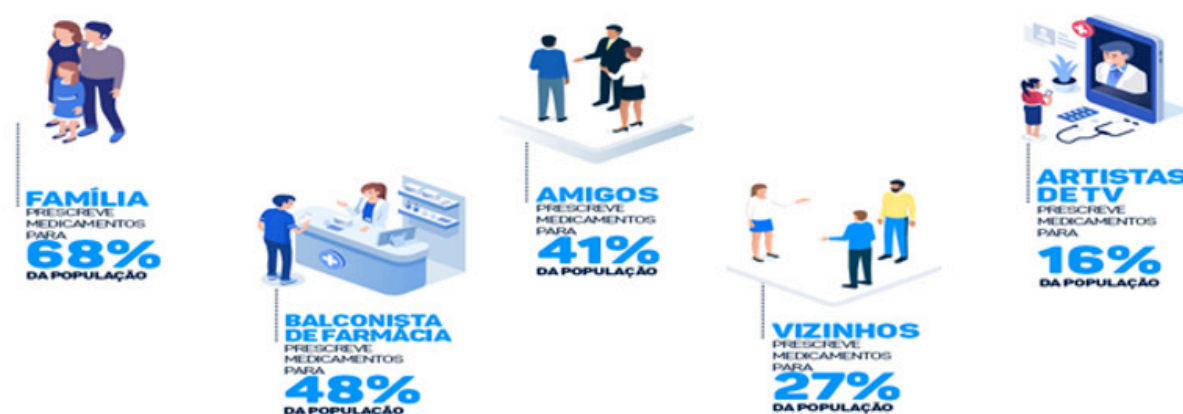
Figura 3. Você usa medicamentos, orientado por quem, além de seu médico?